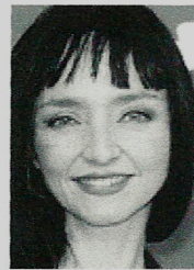
María de Medeiros